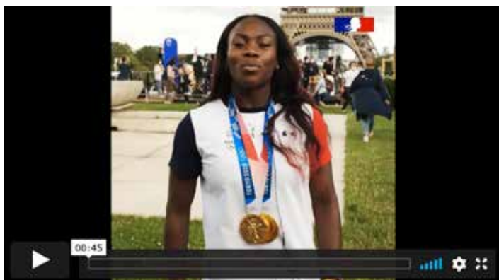
Claris Agbegnenou, double championne olympique de judo

Une opération similaire sera conduite par le ministère chargé des Sports en association avec le Comité Paralympique et Sportif Français à l'issue des jeux Paralympiques de Tokyo début septembre.