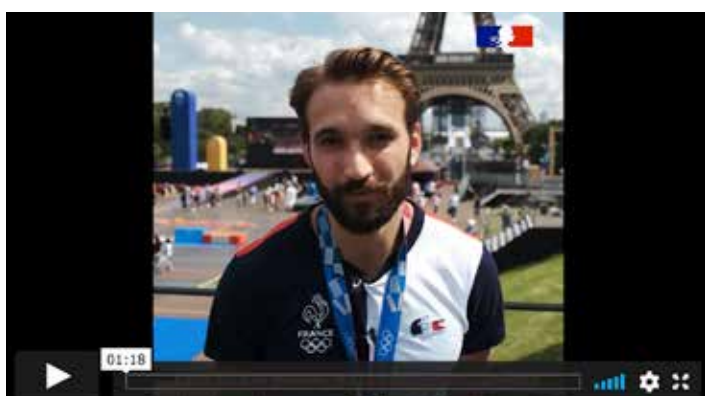
Romain Cannone, champion olympique d'épée