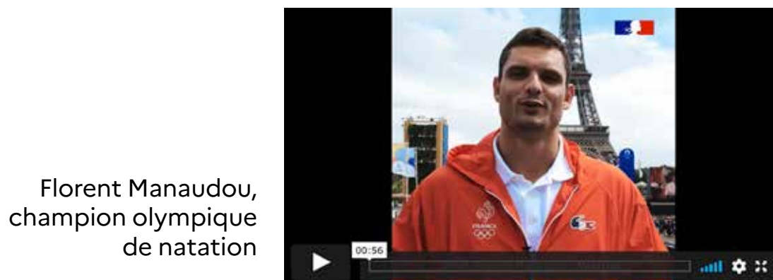
Florent Manaudou, champion olympique de natation